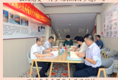
医院党委委员集中学习研讨