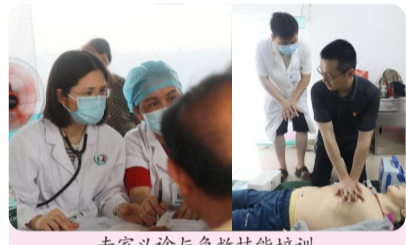
专家义诊与急救技能培训