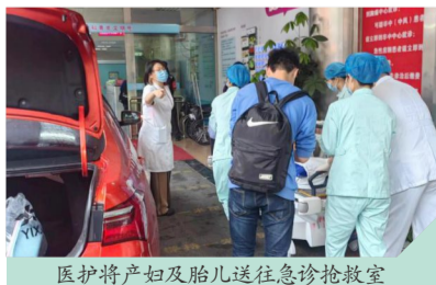
医护将产妇及胎儿送往急诊抢救室

大约9:35, 出租车到达广医三院急诊门口, 早已等候在旁的急诊科、产科、儿科医护赶紧上前查看。