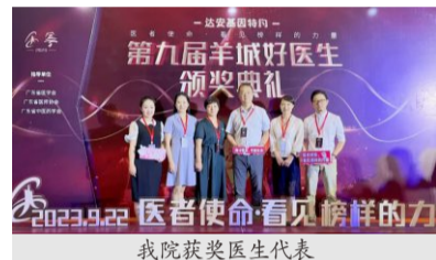
我院获奖医生代表