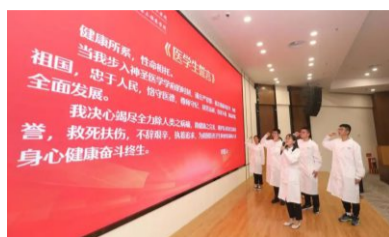
医学生誓言宣誓照片

基垒台，用恒心筑牢人生之基。三是珍视“敬畏之情”，立德修身，用爱心丈量人生经纬。