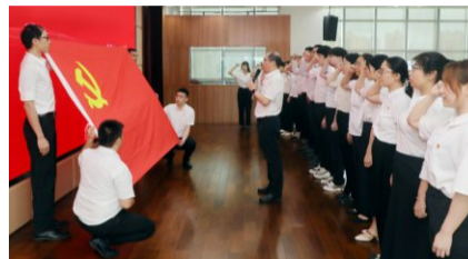
预备党员入党宣誓

体党员提出三点要求:一要坚持全面从严治党,切实领悟“国之大者”;二要坚持学思践悟,推深做实主题教育;三要坚持勇毅前行,踔厉推进高质量发展。