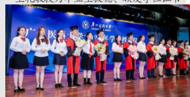
学生代表为老师们献花