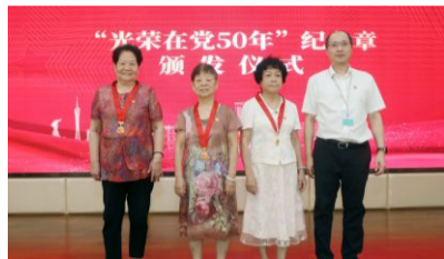
颁发“光荣在党50年”纪念章