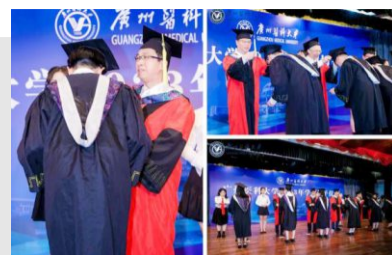
主礼教授为毕业生授流苏、颁发学位证书

五年的大学时光，珍贵而短暂，相逢又告别，归帆又离岸。希望毕业生们在今后的人生道路上，始终保持探索学习的热情，不懈拼搏向上，铭记医学生誓言，带着广医精神与柔济精神奔赴未来，在守护人民健康的神圣事业中书写人生新华章！（文/图：学生管理科）