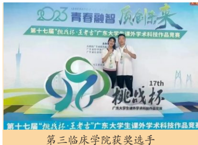
第三临床学院获奖选手

近日,第十七届“挑战杯”广东大学生课外学术科技作品竞赛终审决赛在中山大学举行。第三临床学院学生团队表现优异,从全省808个终审参赛队伍中脱颖而出,作品《一套降低孕妇产后出血的装置》荣获特等奖。