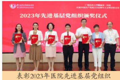
表彰2023年医院先进基层党组织

近年来,医院党委以“党支部工作法”和党建“四有”工程建设为重要抓手,推动支部抓好规范化建设,创建党建品牌,促进党建工作与业务工作相结合取得了重要成绩。会议上,儿科党支部、妇研所第二党支部、医技第三党支部分别就