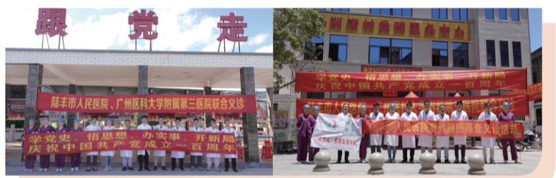
金厢镇前列腺癌免费筛查义诊活动

在辖区内进行大范围免费恶性肿瘤早期筛查不仅能提升民众健康意识，对于该院诊疗水平提升也有诸多益处。2020年初，广医三院-陆丰帮扶队联合陆丰市人民医院泌尿外科成功向中国基层医疗基金会申请了前列腺癌早期筛查资助项目，该专项基金用