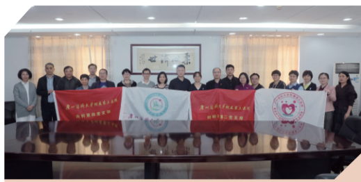
2020年12月，陆丰帮扶医疗队出发

经完成第二年驻点帮扶任务，通过“组团式”接力帮扶，进一步提升陆丰市人民医院医疗技术和水平，