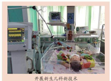
开展新生儿科新技术