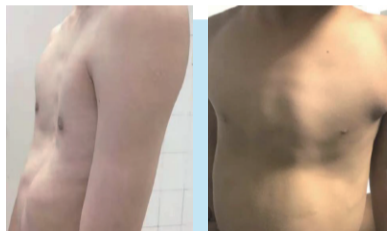
漏斗胸(左)和鸡胸(右)

漏斗胸和鸡胸是两种最常见的胸部发育畸形。漏斗胸指胸骨、肋软骨及部分肋骨向背侧凹陷畸形，形成漏斗状；鸡胸则是向胸侧凸出畸形。