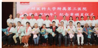
现场颁发纪念章，老党员、老党员合照