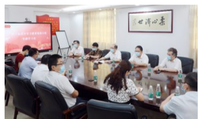
医院党委委员、各支部书记在行政楼五楼1号会议室观看直播

7月1日上午，庆祝中国共产党成立100周年大会在北京天安门广场隆重举行。中共中央总书记、国家主席、中央军委主席习近平发表重要讲话，号召全体中国共产党党员，牢记初心使命，坚定理想信念，践行党的宗旨，永远保持同人民群众的血肉联系，始终同人民想在一起、干在一起，风雨同舟、同甘共苦，继续为实现人民对美好生活的向往不懈努力，努力为党和人民争取更大光荣！广医三院党员干部群众对大会热切关注，怀着激动的心情，纷纷认真组织收看收听庆祝大会盛况。