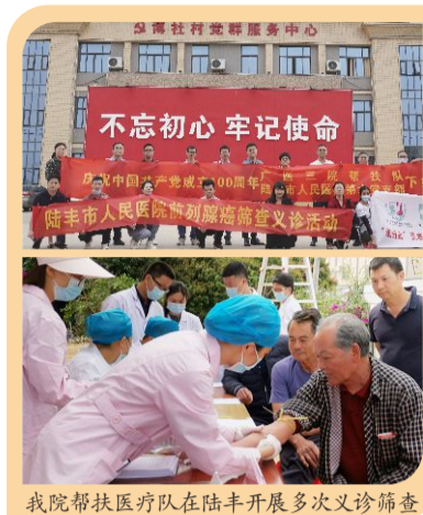
我院帮扶医疗队在陆丰开展多次义诊筛查