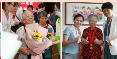
上门探访，发放纪念章