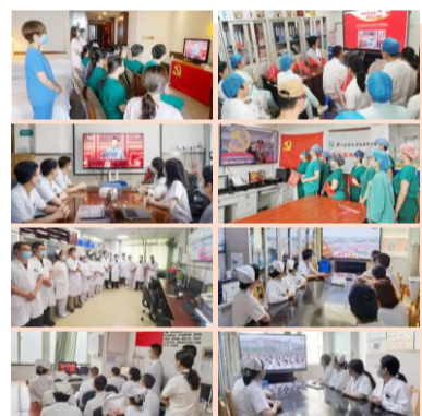
医院各科室医护人员在保证临床工作的情况下纷纷自发组织收看直播

党委书记苏广武表示，收看大会、心潮澎湃，更加坚定信念跟党走！新的征程上，我们必须坚持党的全面领导，进一步增强“四个意识”、坚定“四个自信”、做到“两个维护”，牢记“国之大者”，充分发挥党总揽全局、协调各方的领导核心作用；要进一步强化党组织建设，增强党组织战斗力，为守护人民健康幸福，为下一个一个百年的辉煌接力奋斗，不忘初心，牢记使命！