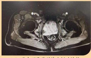
MRI片中可见前列腺右侧叶肿物，包膜已破坏，右侧精囊侵犯