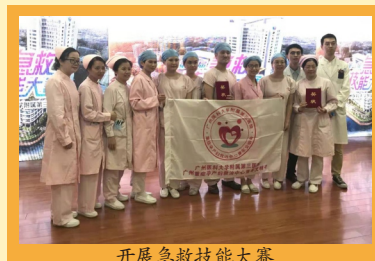
开展急救技能大赛

组织开展青年科普能力大赛、小创造小发明大赛、青年职工急救技能大赛、读片大赛等，打造岗位技能和创新平台，鼓励青年成长成才。