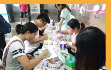
医务社工进驻医院