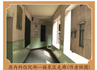
原内科住院部一楼东区走廊

2006年初, 市政府把市二医院划归广州医科大学管理, 成为广医三院; 而也正是在这消息宣布之前的两个月, 由于工作调动, 我到广州医科大学从事行政管理部门工作。由于工作的安排, 我又能有机会常常回到这里, 与昔日的老师同学沟通交流, 让我有机会与这所百年老院再续前缘。