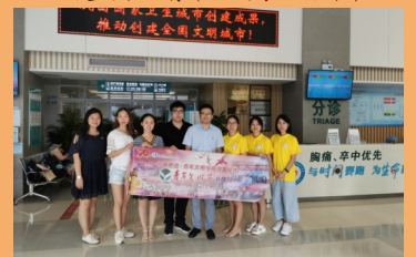
举行青年文明号开放周