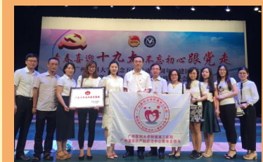
广州重症孕产妇救治中心荣获广东省青年五四奖章集体荣誉