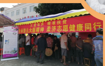
传承梁碧儿大医精神