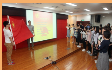
纪念五四，重温誓词

集体学习交流，确保有效提高；通过开展“红色阅读”，根植红色“基因”，筑牢青年理想信念的根基。