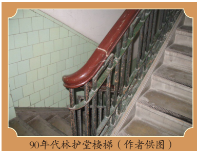
90年代林护堂楼梯

这样的情形, 放在医患关系复杂的今日是难以想象的, 这是怎样的人间奇迹, 是一位怎样的好医生(也许是助产士)让母亲逃过了在今天看来完全不可避免的“温柔一刀”呢? 母亲曾不止一次的告诉我, 只知道为她接生的是一位女军医,