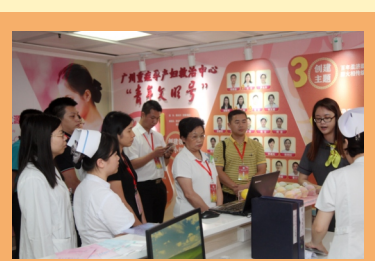
接受国家级青年文明号现场评审

通过青年文明号建设工作营造科室氛围、优化管理与流程、提升锤炼科室文化，凝心聚力促进青年成长，培养优秀青年骨干人才，促进医疗服务质量和患者满意度的提高。