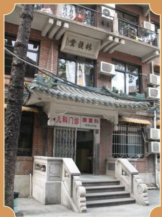
90年代的林护堂外景

百廿载、双甲子 任时光荏苒、岁月匆匆 120年 有太多的故事 想要讲述 有太多的感动 值得铭记 “我与柔济”征文展示 聆听您与柔济故事