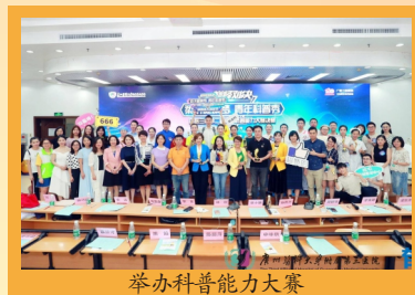
举办科普能力大赛

过去五年是青春的五年，过去五年是奋斗的五年。值共青团广州医科大学附属第三医院第二次代表大会暨共青团广州医科大学附属第三临床学院第二次代表大会到来之际，让我们一起回顾过往，展望未来。