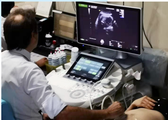
无创胎肺成熟度检测技术

妊娠高血压疾病控制不理想、妊娠期糖尿病、胎盘植入、胎儿异常, 这些需要提前分娩或剖宫产的高危孕产妇, 在分娩或者剖宫产前, 进行胎肺成熟度预测, 判断胎儿肺部发育情况, 对降低母体和新生儿并发症的发生, 提高胎儿存活率有着积极作用。然而, 现有的胎肺成熟预测需经过羊膜腔穿刺术实现, 即直接抽取羊水, 属于有创操作, 有一定的流产风险, 因此, 临床上大多数孕产妇不愿意接受。