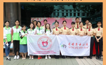
青年文明号共建，与广州地铁青年文明号交流