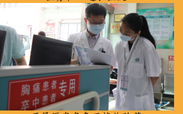
开展医患角色互换体验园