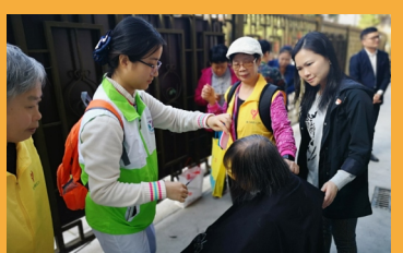
青春志愿服务：春节义剪

柔济爱心志愿服务大队成为医院一张闪亮的“志愿服务品牌”。“绿马甲”的身影进社区、走山区、进校园、下基层，打造了医患角色互换体验园、健康教育进校园、医务人员子女夏令营、医疗服务下基层、暑期三下乡等一些列志愿服务品牌。2019年我院与广州市启创社会工作服务中心签订购买服务协议，3名医务社工常住我院开展服务，实现了医务社工工作的突破。