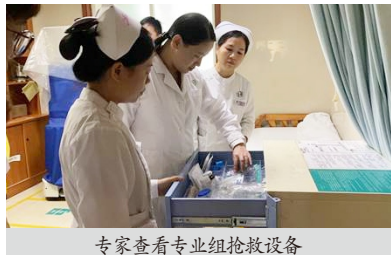
专家查看专业组抢救设备