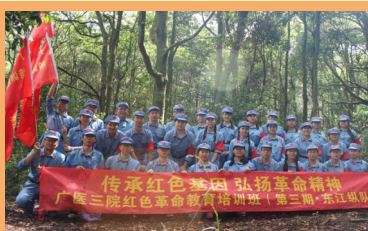
重走罗浮山红色革命道路