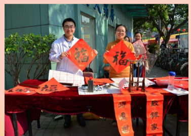
荔湾医院医生与小志愿者挥毫送福

而在专家保健咨询的旁边，志愿者们挥毫送福吸引了不少市民朋友的关注，大写的福字寓意新年的好兆头，不少朋友们纷纷等着“求福”呢！除了福字，活动还送出了柔济名医健康日历、利是封等小礼品；送健康、送福气的活动得到了市民朋友的广泛好评！