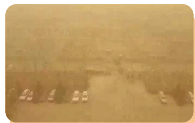
风沙一来,开启“下土”模式

些外在的困难面前,两位医生并没有被击退,反而更加深思此行的意义:短短一年半,要为新疆做什么?能给新疆留下什么?