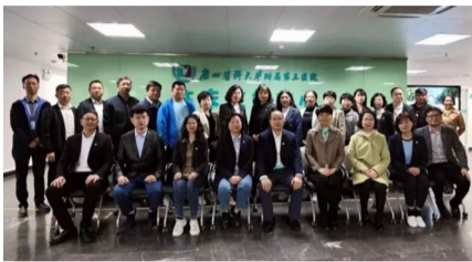
我院与安顺妇幼保健院签订对口帮扶协议

号召，高度重视援黔工作，将援黔工作纳入党委工作要点，先后帮扶贵州省毕节市妇幼保健院、安顺市妇幼保健院。以“党政一把手负总责、分管领导抓具体、各支部各部门抓落实”为原则，逐级明确分工、层层压实