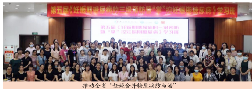
推动全省“妊娠合并糖尿病防与治”