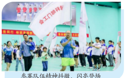
参赛队伍精神抖擞，闪亮登场