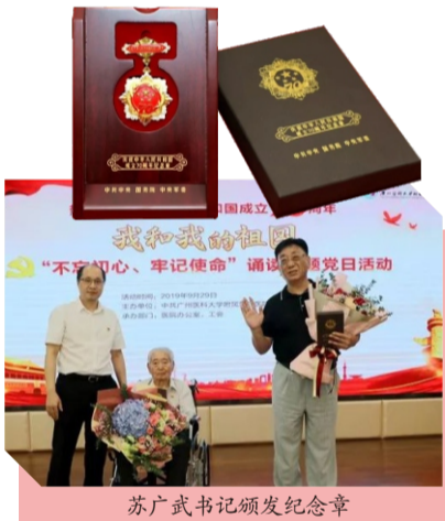
苏广武书记颁发纪念章

据悉，颁发“庆祝中华人民共和国成立70周年”纪念章是新中国成立70周年系列庆祝活动的重要组成部分，以此对新中国成立前参加革命工作的老同志或新中国成立后获得国家表彰奖励的人士等为中国革命和建设发展做出贡献的各领域人员，进行特别嘉奖。