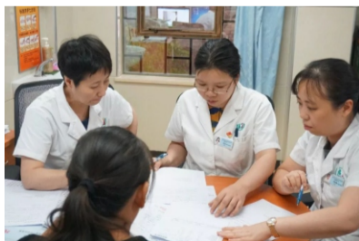
妇科、高危产科、生殖医学科专家同时在门诊为病人看诊

学科门诊”后,近期生殖医学中心进一步推出针对“不孕症合并相关疾病多学科门诊”,旨在助孕治疗前高效、精准解决相关的综合问题。