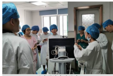
医疗器械实地检查

9月25日,广东省食品药品监督管理局委派的医疗器械临床试验检查专家一行4人对我院《一项评价分娩监护系统用于盆骨测量和产程监测的安全性和有效性的多中心、开放、自身对照的临床试验》临